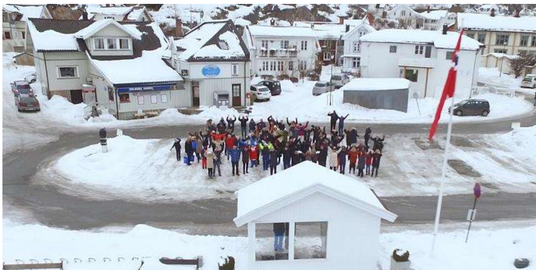
Holmsbu - Hele året