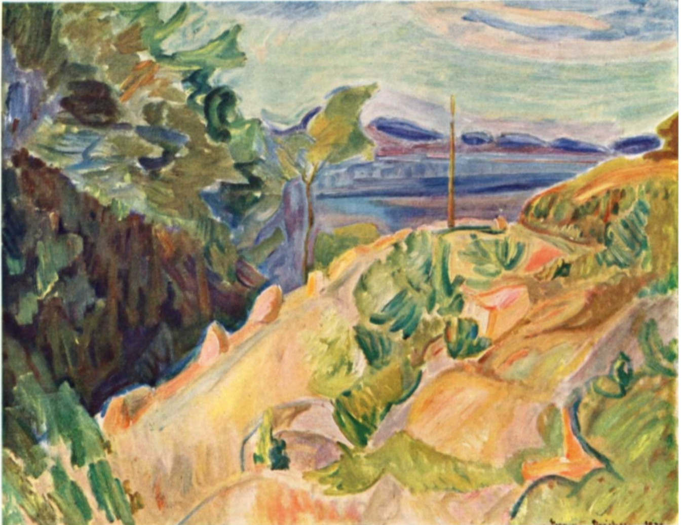
Et parti av Støaveien ved Bråtan, Thorvald Eriksen, 1920.

Eriksen var en av de tre mest kjente Holmsbumalerne og benyttet motiv fra denne veien i flere av sine verk på 1920-tallet.